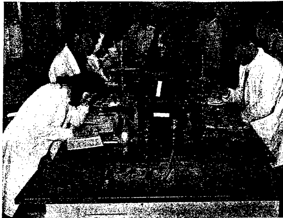
طلاب وطليات الجامعة على طريق البحث العلمي

البحث العلمي والتكنولوجيا هما الركيزة الأساسية لأي بناء عصري وعلى ضوء اعتماد وسائل البحث العلمي يتحدد موقع الأمة من سلم التقدم والازدهار. وإذا كانت تكسة حزينان قد أضحت نقطة تحول فسيحياتنا فما أحوالنا الى البحث العلمي في كافة المجالات ليأخذ دوره الفعالي في كافة المجالات العلمية.